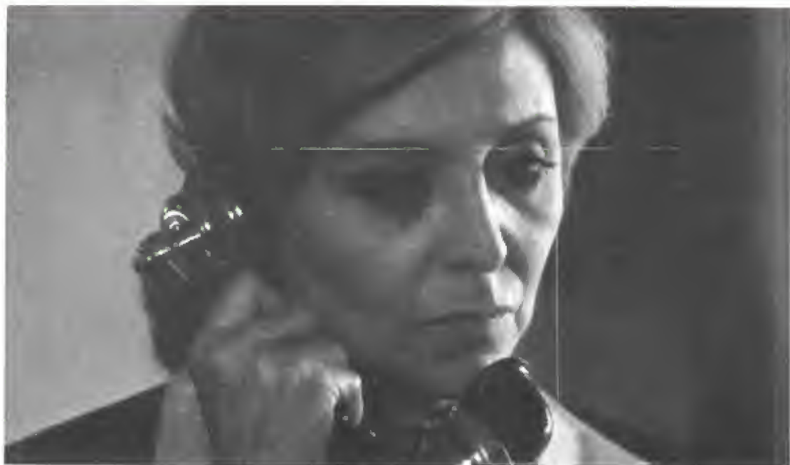
Amparo Soler Leal